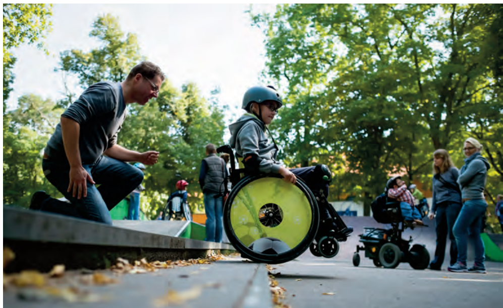
Teilnehmerin bei einem Rollstuhltraining