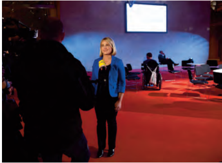
Verena Bentele, Behindertenbeauftragte

Hintergrund des Leitfadens ist die Überzeugung, dass über Medien im Sinne der UN-Behindertenrechtskonvention eine neue Bewusstseinsbildung erreicht werden kann, um ein inklusives Leben von behinderten und nicht behinderten Menschen zu ermöglichen – ob in der Schule, im Arbeitsleben oder in der Freizeit. Der Leitfaden ist ein Produkt des Fachausschusses »Kommunikation und Medien« im Auftrag der Beauftragten der Bundesregierung für die Belange behinderter Menschen, Verena Bentele, und basiert auf den Erfahrungen und Medienworkshops des Aktionsbündnisses Seelische Gesundheit und des Projektes »Leidmedien.de« des Sozialhelden e. V. Mitgewirkt haben außerdem viele andere Verbände behinderter Menschen sowie Expert_innen aus dem Medienbereich.